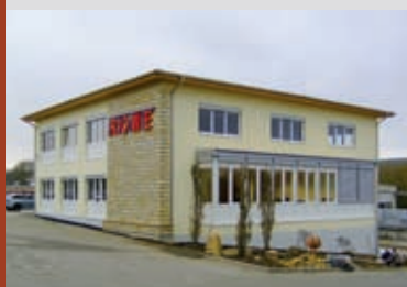
▲▼ Firma ROWE, Bubenheim 2007 Neubau Verwaltungsgebäude