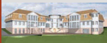
▲▼ Hofgut Claß, Vendersheim aktuelles Bauvorhaben 2009