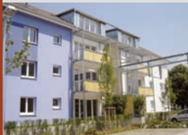
▲ Liebenauer Feld, Worms 2007 Ehemalige Kasernen, umgebaut zu MFH