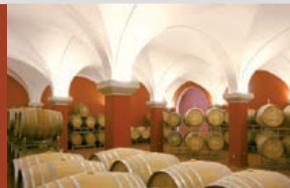
▲ Weingut Spieß, Bechtheim 2007 Neubau