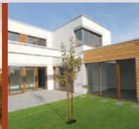
▲ Lebenszyklushäuser, Worms 2006 Neubau EFH