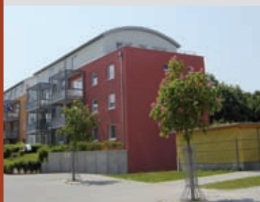
▲ Liebenauer Feld, Worms 2006 Ehemalige Kasernen, umgebaut zu MFH